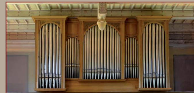
Grafik & Design Marlies Roschke